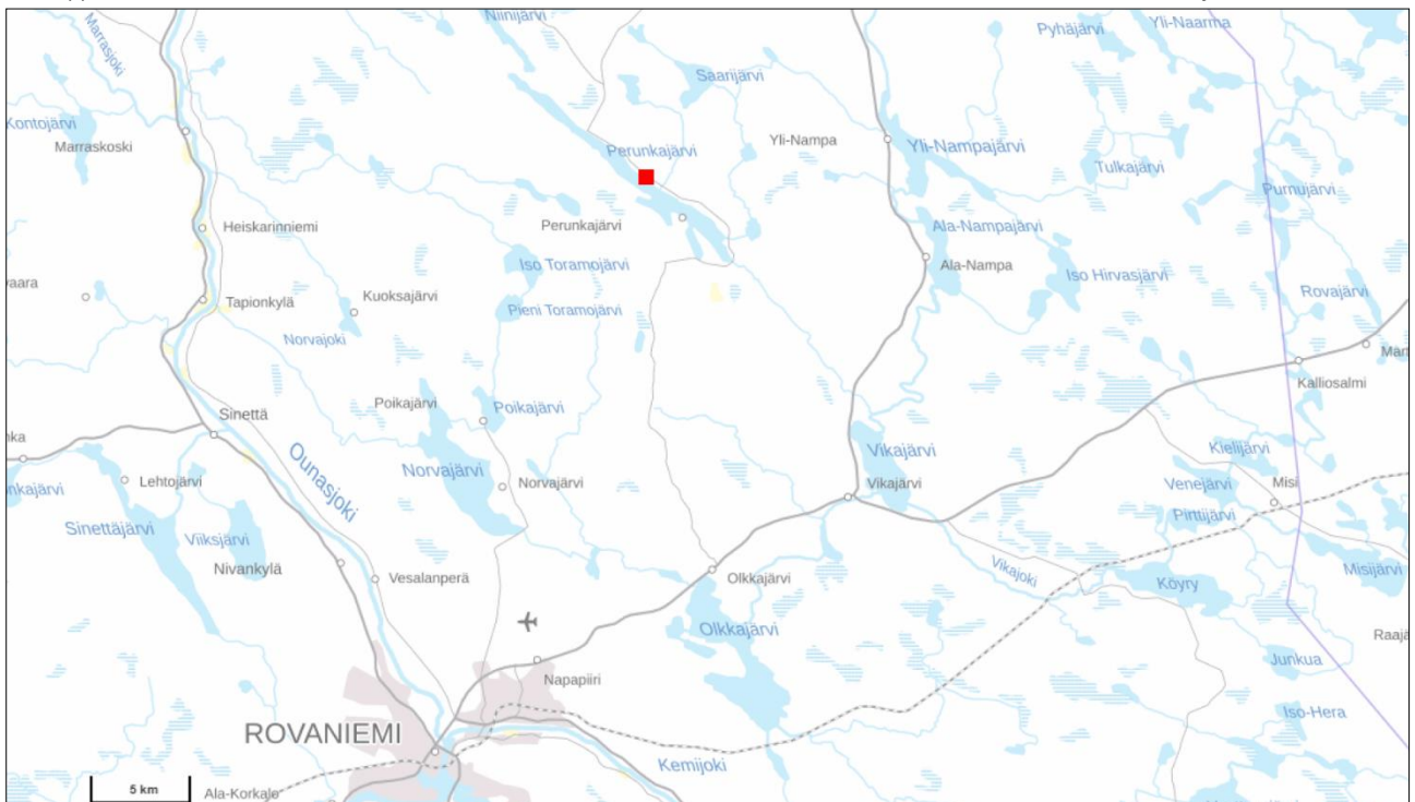
Suunnittelualueen sijainti. Punaisella neliöllä on osoitettu kaava-alueen sijainti. (karttälähde: kartta.paikkatietoikkuna.fi)

Kaava-alue sijaitsee n. 30 km Rovaniemen keskustasta pohjoiseen, Perunkajärven itä/koillisrannalla. Teitä pitkin etäisyyttä Rovaniemen keskustasta kaava-alueelle tulee n. 46 km. Kaava-alueita ovat ranta-alueella sijaitseva kiinteistö