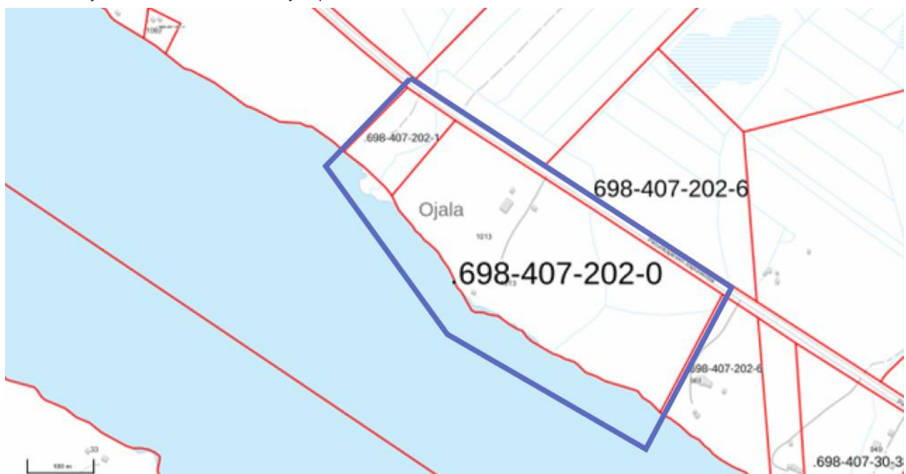
Kaavan suunnittelualue. Suunnittelualueen likimääräinen raja on merkitty karttaan sinisellä.

Suunnittelutyön tarkoituksena on laatia asemakaava Rovaniemen kaupungin alueelle, Perunkajärven rannalla sijaitsevalle Ojalan tilalle sekä viereiselle Viikilän tilalle ja välittömästi niiden edustalla olevalle vesialueelle. Kaavan tarkoituksena on tutkia mahdollisuudet luonnonläheisen ja kestävä matkailuhankkeen toteuttamiselle. Suunnittelualue käsittää hakijan omistamat kiinteistöt Ojala 698–407–202–0, jonka pinta-ala on 9,99 ha ja Viikilä 698–407–202–1, jonka pinta-ala on 1,29 ha sekä lähimpiä yhteisiä vesialueita em. tilojen osuiksi mukaan n. 7,87 ha. Kaava-alueen laajuus on yhteensä n. 19,15 ha. Suunnittelualueen likimääräinen raja on esitetty kansilehden kuvassa sekä alla olevassa kartassa. Tarkastelu- ja vaikutusalue on tätä laajempi.